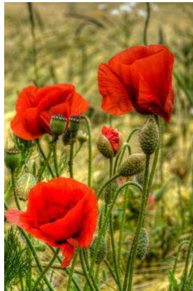
Bild: Georgia O'Keeffe, 1927

Herzlich Willkommen zur Lesung im Labyrinth